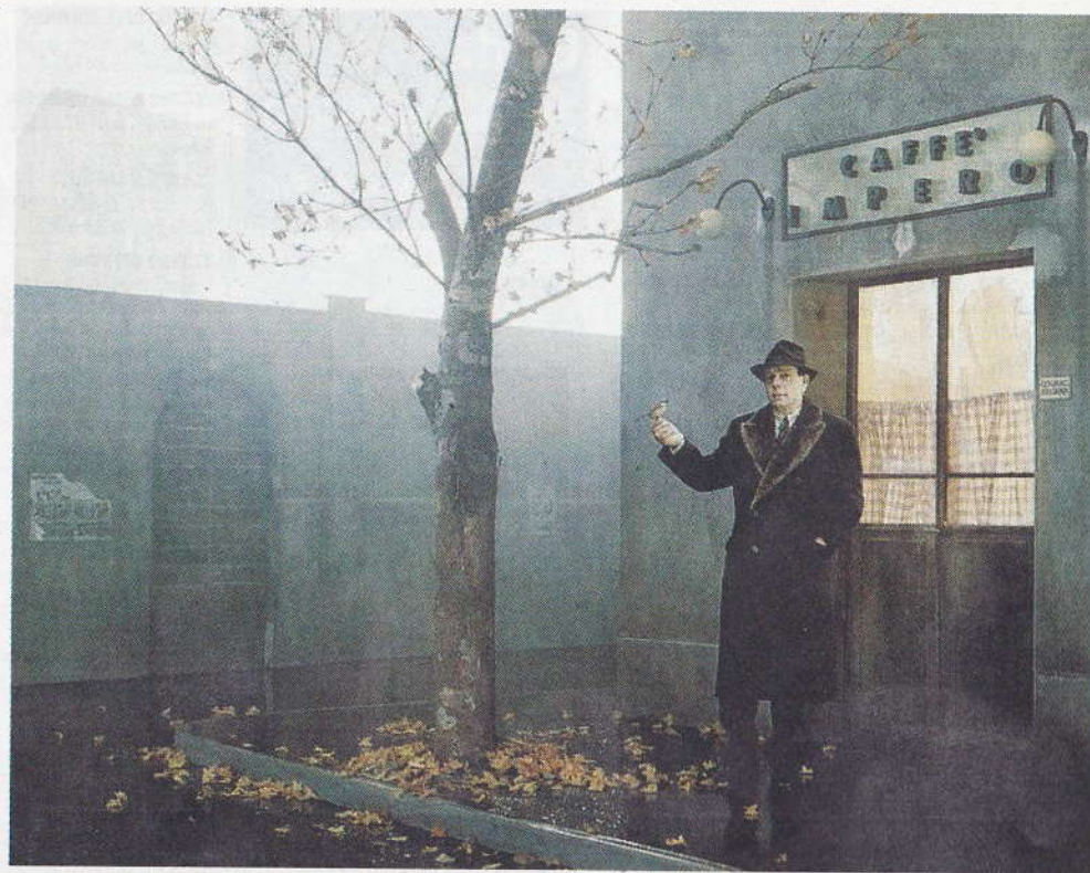
Cappotti Un'altra presenza umana per il progetto che racconta gli incroci di cinque storie

un mondo che la sua età anagrafica non gli ha permesso di conoscere ma che ha incontrato e soprattutto visto nelle pagine dei libri, nei racconti di famiglia, nei film. Poi, con minuziosa precisione filologica, Ventura si veste da borghese anni Cinquanta, da operaio, da soldato, da reduce, e si ambienta negli spazi umidi di questa misteriosa città che è cresciuta con lui, nel suo immaginario, di progetto in progetto, fotografia dopo fotografia.